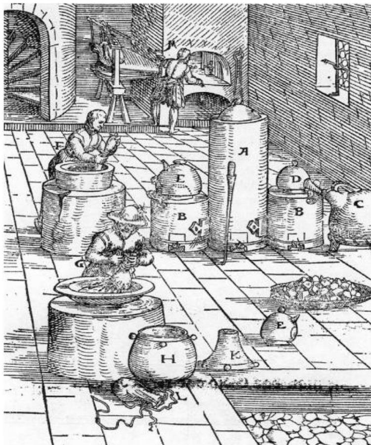
FIGURA 3: USO DO MERCÚRIO PARA DISSOLVER O OURO CONTIDO NO CONCENTRADO DO MINÉRIO.

Todos esses processos nos fazem refletir sobre a importância da história em seu contexto, e como os conhecimentos químicos foram, desde aquela época, essenciais em diversas finalidades. Ao analisar estes relatos históricos, podemos perceber que os conhecimentos químicos estão relacionados com as práticas e técnicas de extração, manipulação e separação de materiais, neste caso, o ouro. Assim, as atividades como a separação de misturas e uso de materiais e/ou elementos, se destacam fortemente. A figura 3 representa a amalgamação e a recuperação do mercúrio, representando o famoso termo “semelhante dissolve semelhante”, muito conhecido até hoje, e talvez um dos termos mais antigos da história da química.