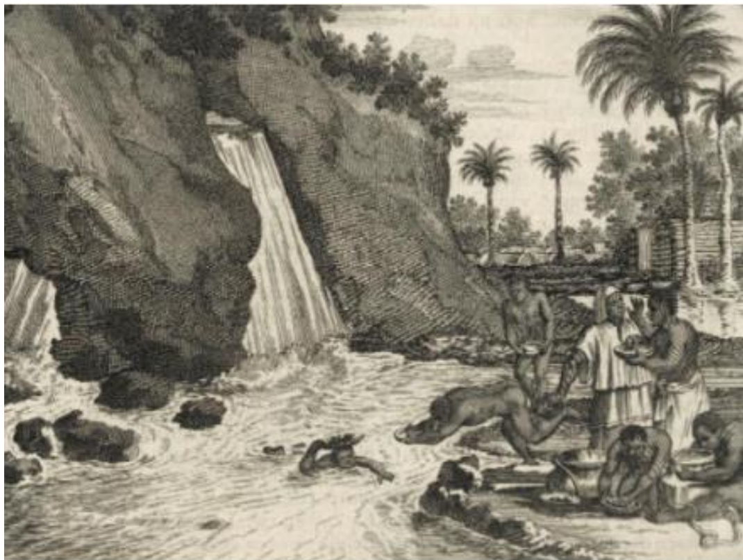
FIGURA 4: A RECOLHA DO OURO, OLFERT DAPPER, 1686.

seca, apesar disso, a figura 4 apresenta, mesmo com uma difícil visualização, três mulheres envolvidas no processo. Destas, a primeira está dentro do rio, com uma bateia na cabeça. A segunda está de pé, apresentando algo a um homem e a terceira se encontra sentada do lado da segunda, ao que parece examinando um balde madeira, provavelmente para retirada de ouro. Além disso, a figura nos permite perceber as técnicas empregadas na exploração mineral são semelhantes às usadas no Brasil, mesmo que com ênfase europeia. A autora aponta também que o foco principal era as minas, e não os rios como apresentado na figura.