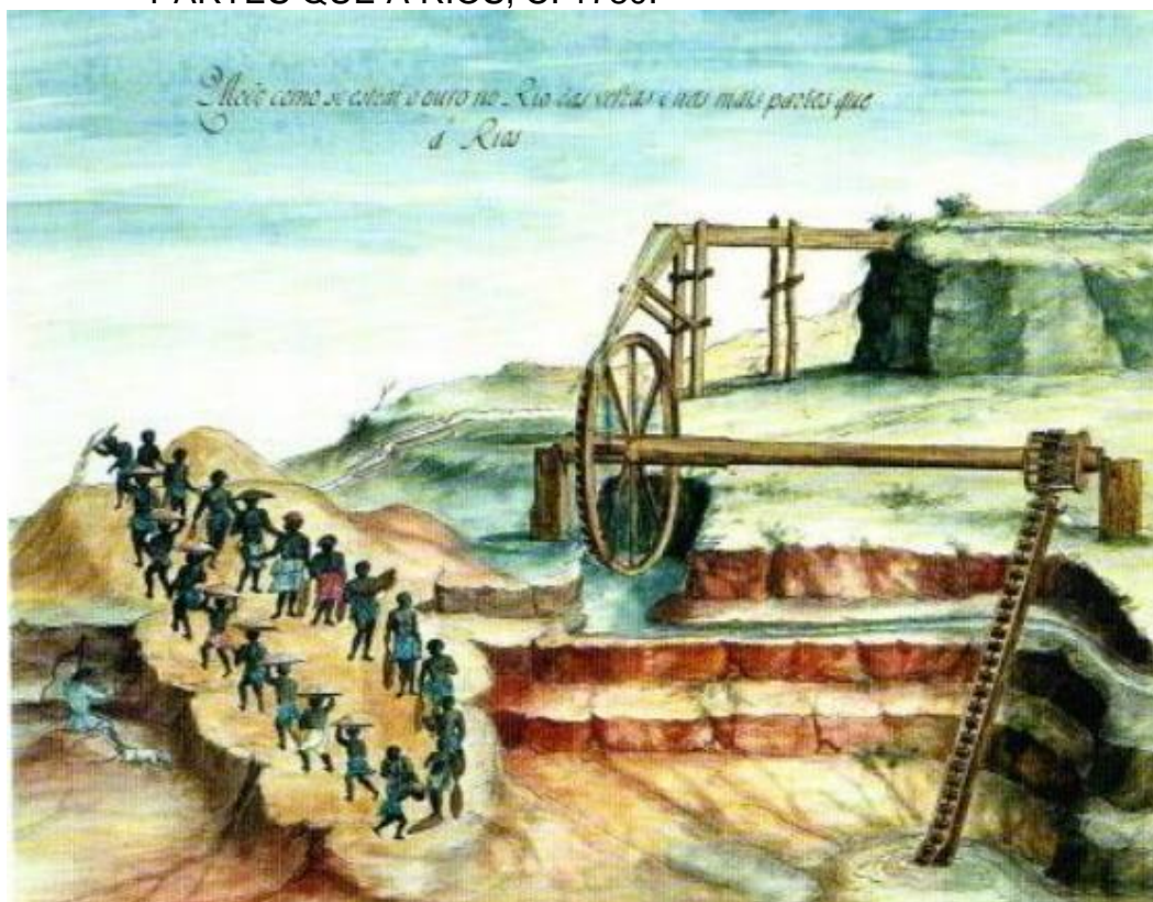
FIGURA 5: COMO SE EXTRAÍ O OURO NO RIO DAS VELHAS E NAS MAIS PARTES QUE À RIOS, C. 1780.