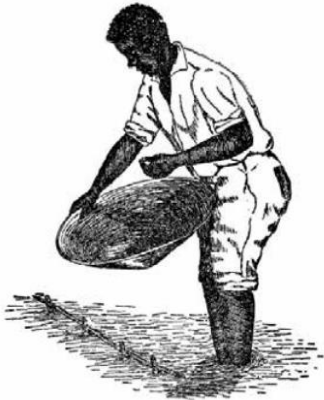
FIGURA 2: USO DAS BATEIAS NAS MARGENS DOS RIOS.

No processo de exploração e extração, os mineiros trabalharam as areias e cascalhos auríferos das margens dos rios, concentrando as partículas de ouro com bateia usando a própria água do rio. Nesse processo os trabalhadores empregavam essencialmente peneiras (separação por diferença de tamanho de partícula) ou bateias (separação por diferença de densidade) (FIGUEIRÔA, 2006). Ferrand (1998), relata que esse meio primitivo de exploração se aperfeiçoou pouco a pouco. Além do trabalho nos rios, também existia a exploração nos flancos das montanhas, que também são citados por Ferrand. A figura 2 apresenta o trabalho realizado por garimpeiros nas margens dos rios.